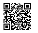
ស្ត្រីន QR Code

គូសតាមស្នាមចុចរាងខ្សែកោងភ្ជាប់ពីចំណុចម្ខាងទៅ ចំណុចម្ខាងទៀតលើខ្ទង់ដៃ